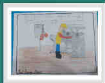
Niño - 8 años Orcopampa - Buenaventura