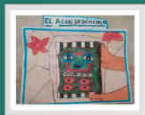
Niño - 6 años Orcopampa - Buenaventura

"SI NOS CUIDAMOS JUNTOS, NOS CUIDAMOS MEJOR"